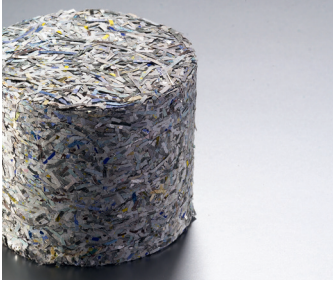
Brikett eines BDS SC-Systems